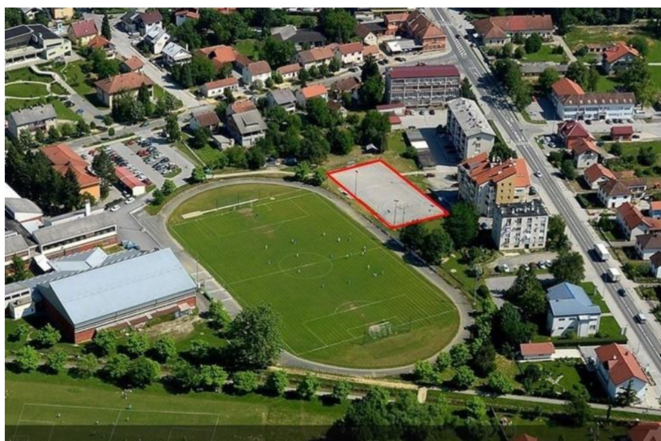
Slika 1. Nogometno igralište „Športski park Novi Marof“ s igralištima za razne sportove koje je u 2021. godini uređeno s novom Bergo podlogom

Grad Novi Marof nije ostvarivao rashode po osnovi upravljanja i raspolaganja nogometnim igralištima. Rashodi za održavanje i drugi rashodi poslovanja odnose se na režijske troškove struje, vode i energenta za grijanje nastale korištenjem nogometnog igrališta. Režijski troškovi i troškovi održavanja podmiruju se na temelju računa dobavljača. Sve rashode snosi Nogometni klub kome je nogometno igralište dano na upravljanje.